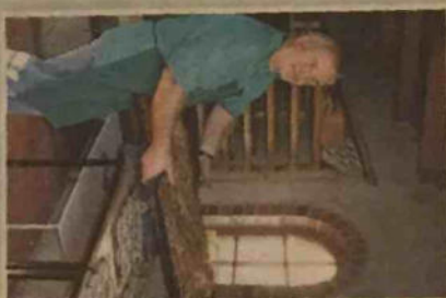
Aus dem Reudener Dorfbackofen kommt frischer Kuchen.

Reuden (pwt) • Frischen Speckkuchen, Streusel- und Kirschstreuselkuchen sowie Brot aus dem Dorfbackofen gibt es morgen wieder in Reuden/Anhalt. Der Traditionsschub lädt zum Backofenfest ein. Los geht es um 14.30 Uhr am Festgelände direkt neben dem Backofen. Für musikalische Unterhaltung sorgt DJ Zimmermann. Vorstellen wird sich den Besuchern der Böhlaer Judoverein mit ein paar Vorführungen. Für die Kinder gibt es eine Hüpfburg und Quadfahren. An der Festwiese sind Kegeln und Torstange-schießen möglich. Bauernkate und Dorfmauseum werden geöffnet sein.